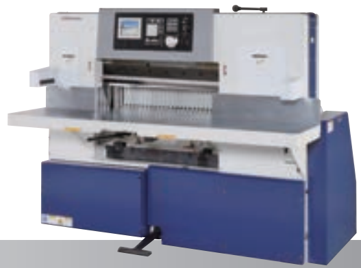
Paper Cutting Machine KC82