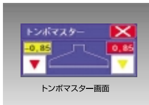
トンボマスター画面